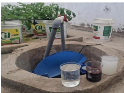
Figura 2 Incorporación de solución nutritiva

b) Preparación y aplicación de Solución nutritiva la Molina. Con las indicaciones de la Molina se precedió a preparar la solución nutritiva, Solución A en 5 lt, que contiene Nitrato de Potasio 13,5% N y 46% K 2 O, Nitrato de Amonio 31% N y Sulfato triple de calcio 45% P 2 O 5 , 20% CaO, Solución B en 2 litro que contiene Sulfato de Magnesio 16% MgO, 13% S, Quelato de Hierro 6% Fe y micronutrientes (Mn, B, Zn, Cu, Mo) y Solución C en 5 lt con 15,5% N, 26% CaO, los cuales se combina con 1000 lt de agua. Para el experimento las combinaciones fueron para el T1 solución A: 1,2 L + B: 0,6 L + C: 1,2 L, T2 A: 1,0 L + B: 0,4 L + C: 1,0 L y T3 A: 0,8 L + B: 0,2 L + C: 0,8 L cada uno de los tratamientos fueron diluidos en 200 L de agua con el cual se realizo el riego por goteo durante 10 minutos cada 3 horas durante el día y cada 5 horas por la noche. El pH de la solución nutritiva se mantuvo en un rango de 5,5 a 6,5 mientras que la conductividad eléctrica varía entre los tratamientos por la cantidad de solución nutritiva incorporado en el T1: 3,1, T2: 2,7 y T3 1,7 como se visualiza en la figura 2.