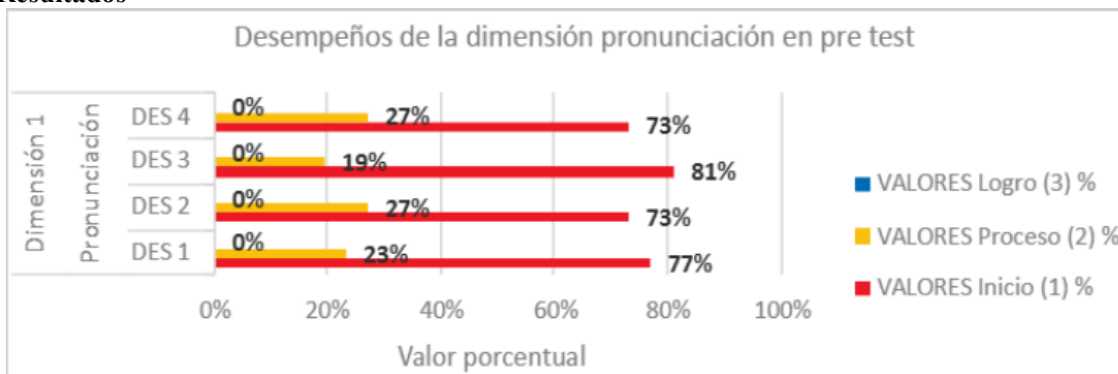
Fig. 1 Resultados porcentuales de los desempeños de la dimensión pronunciación en Pre Test

En la Fig. 1, en la aplicación de los talleres de juegos verbales (rimas, adivinanzas y trabalenguas), en el Pre Test, dimensión pronunciación, en el desempeño 1, el 77% de los niños se ubicaron en el nivel inicio. En el desempeño 2, el 73% de los niños se ubican en el nivel inicio. En el desempeño 3, el 81% de los niños se ubican en el nivel inicio. En el desempeño 4, el 73% de los niños se ubican en el nivel inicio.