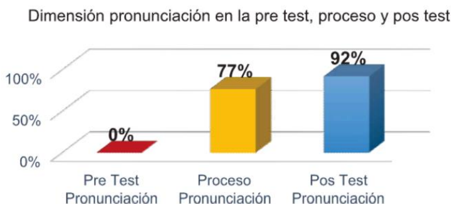
Fig. 4 Resultados porcentuales de la dimensión pronunciación en pre test, proceso y pos test

En el gráfico 3, en el Pre Test, en la dimensión pronunciación, en el desempeño 1, el 88% de los niños se ubican en el nivel logro mientras que en el desempeño 2, el 81% de los niños se ubican en el nivel logro en tanto que en el desempeño 3, el 92% de los niños se ubican en el nivel logro y en el desempeño 4, el 96% de los niños se ubican en el nivel logro.